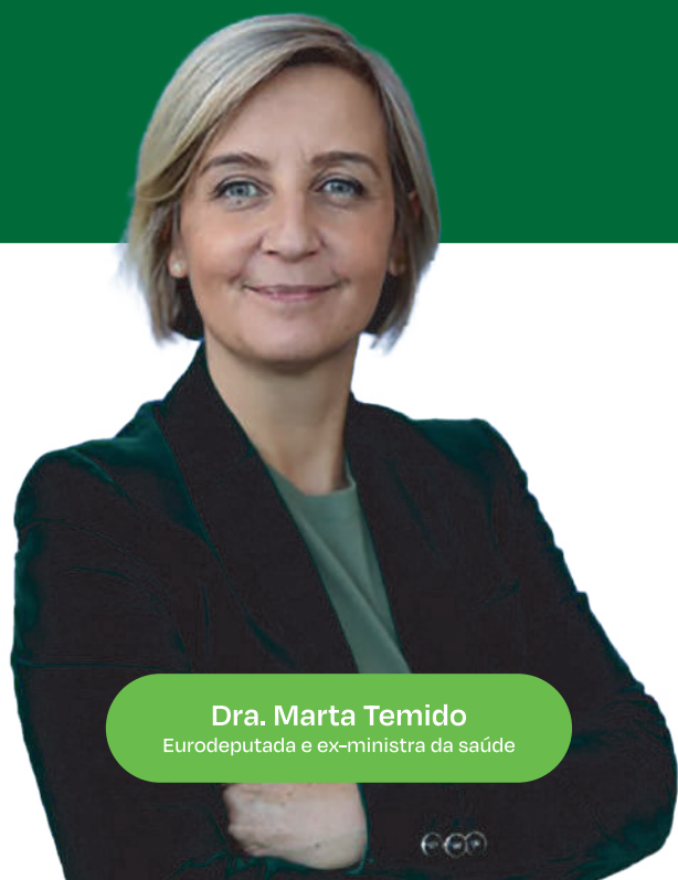
Dra. Marta Temido Eurodeputada e ex-ministra da saúde