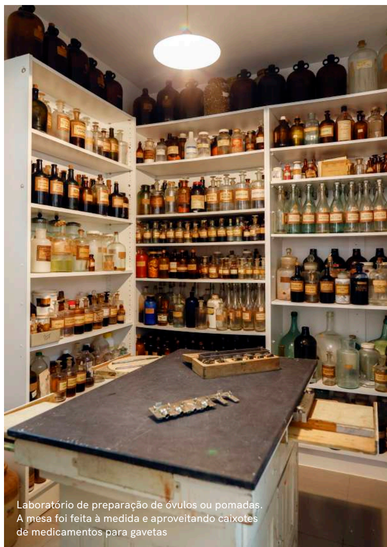
Laboratório de preparação de óvulos ou pomadas. A mesa foi feita à medida e aproveitando caixotes de medicamentos para gavetas

Pela discreta fachada da antiga Farmácia Monte, não se adivinha o recheio. Uma placa em mármore – pedra característica da região – atesta a existência de uma farmácia, entra por razões de saúde ou bem-estar encontra o que não está à espera. A centenária Farmácia Monte é agora uma coleção visitável, graças à colaboração dos descendentes do fundador, do município de Vila Viçosa e do apoio de vários parceiros, entre os quais o Museu da Farmácia, unidos na preservação deste património único.