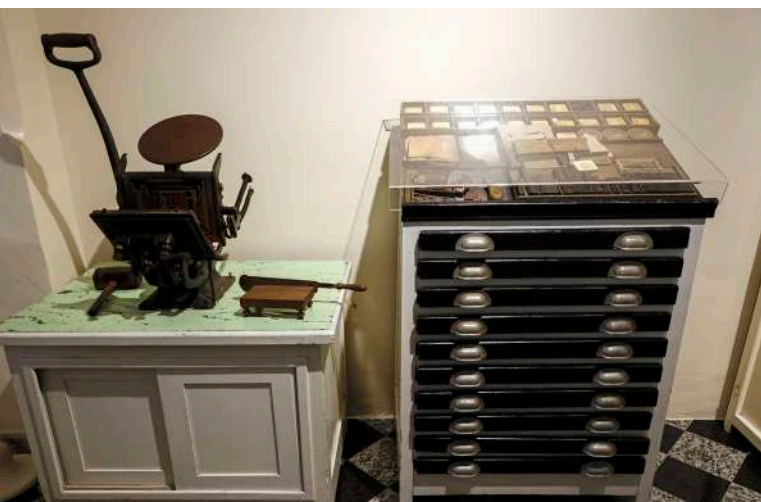
Materiais usados numa pequena prensa onde um tipógrafo vinha imprimir rótulos de medicamentos e formulários