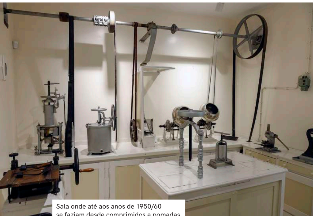
Sala onde até aos anos de 1950/60 se faziam desde comprimidos a pomadas

Escritório dão acesso a um conjunto de salas que parecem ter ficado suspensas no tempo e onde se consegue perceber como funcionava um laboratório farmacêutico de meados do séc. XX – já de alguma dimensão, pois enviava medicamentos para todo o país. Uma fotografia de António do Monte a trabalhar no “Laboratório de Empôlas”, na zona de preparação de injetáveis, comprova que os espaços se mantêm exatamente como eram.