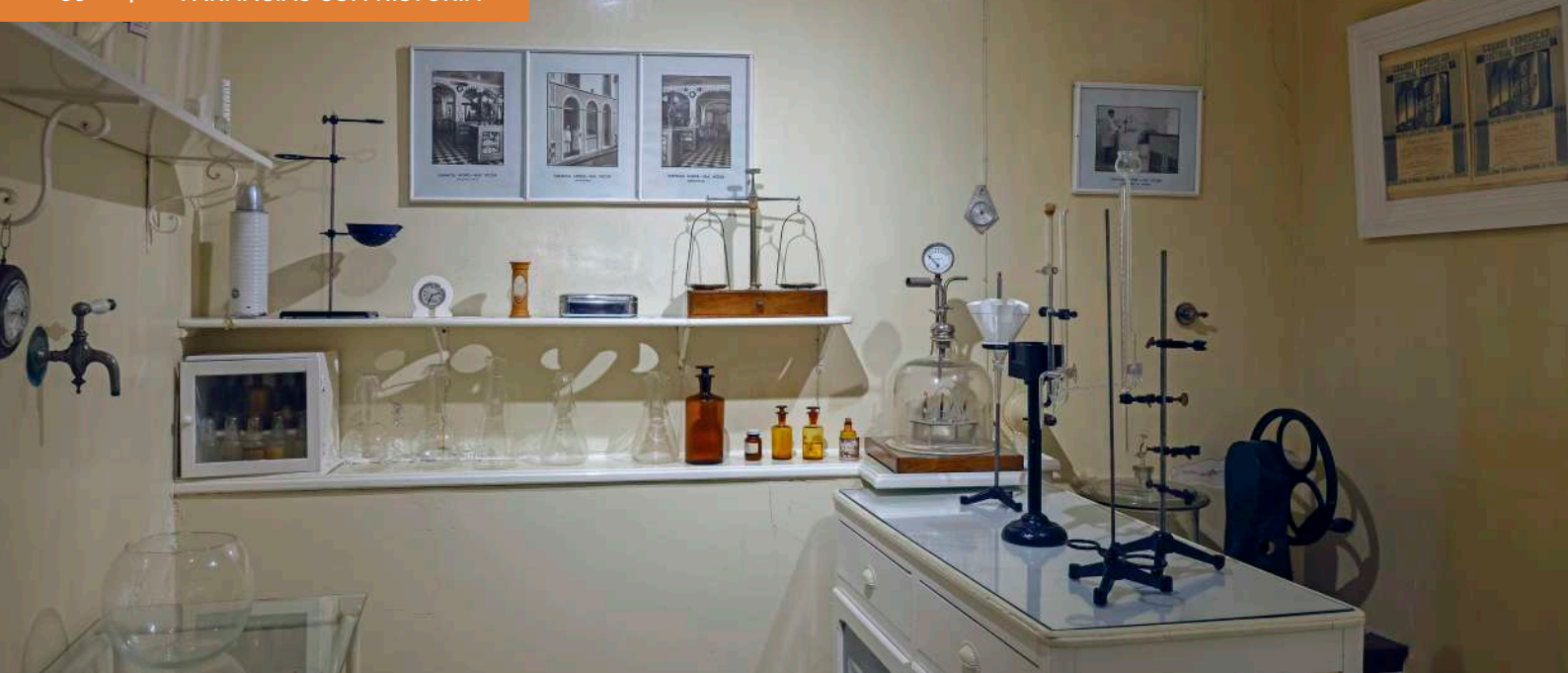
António Victor do Monte no "Laboratório de Empôlas", cuja configuração se mantém na atualidade. Todos os móveis foram feitos à medida do espaço e das funções a que se destinavam