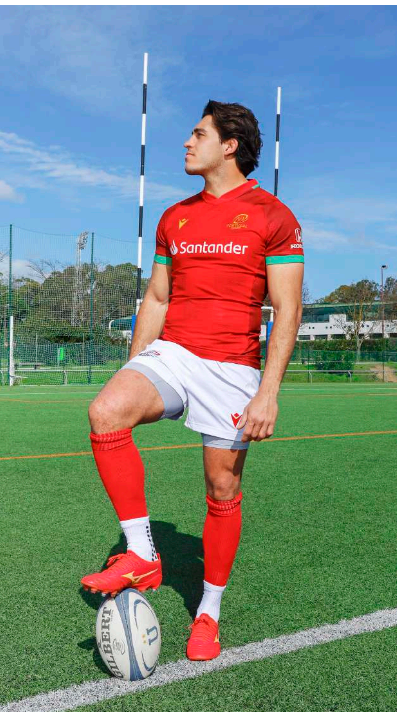
Escolheu a especialidade de cirurgia por influência dos pais

Disciplina, resiliência e superação são as características fundamentais para um atleta